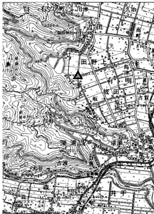
要 図 1/50,000 武雄

備考 平成18年9月29日新設 柱石長 0.01m GPS測量による 現況地目：用悪水路