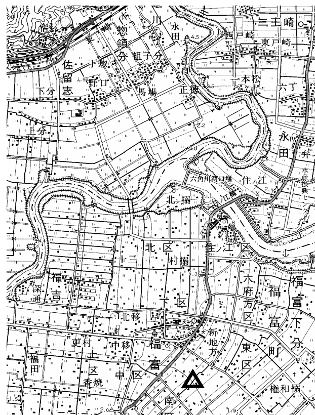
要 図 1/50,000 武雄

備考 平成18年9月28日 新設 柱石長 0.01m GPS測量による 現況地目：用悪水路