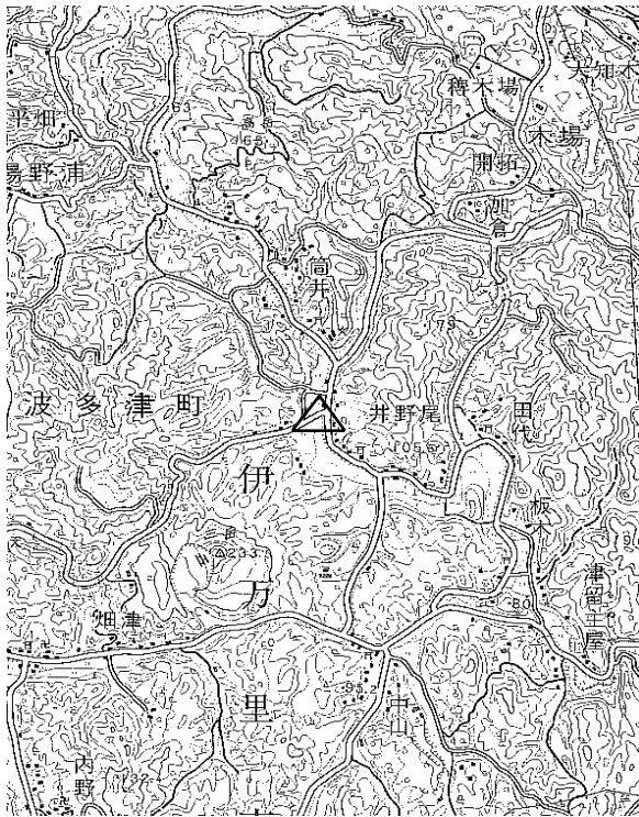
要 図 1/50,000 唐津

備 考 平成18年11月 2日 新設 柱石長0.01m GPS測量による 現況地目：河川